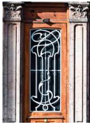
Porte ancienne boucherie, avenue Foch