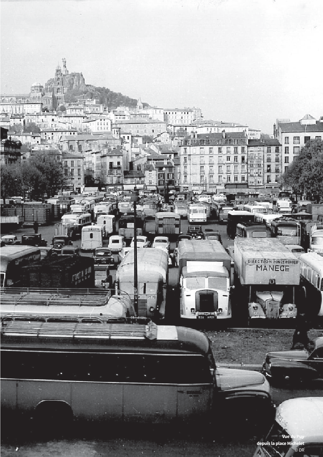
Vue du Puy depuis la place Michelet