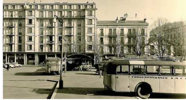
Place Michelet

Découvrez l'exposition Par ici les Celtes en compagnie d'un guide-conférencier. L'occasion d'en savoir davantage sur une période riche mais méconnue, l'âge du Fer dans le sud du Massif central.