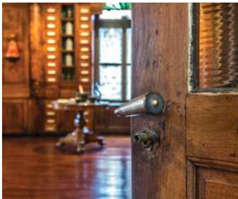
Pharmacie de l'hôtel-Dieu