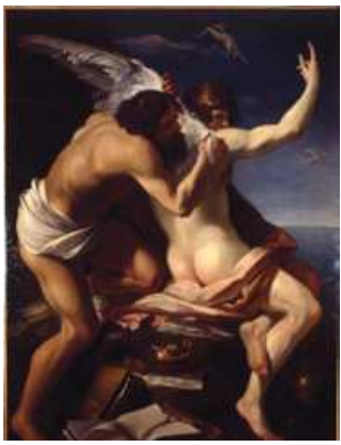
Dédale & Icare, Perrier © musée Crozatier