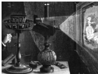
Praxinoscope à projection d'Émile Reynaud