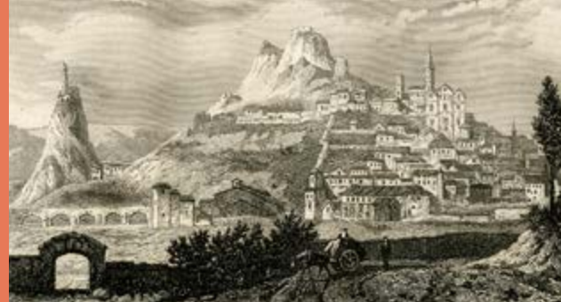
Vue du Puy, Rauch

Création graphique et maquette : → MATRILDE WYDAW → d'après DES SIGNES studio Muchir Desclouds 2018