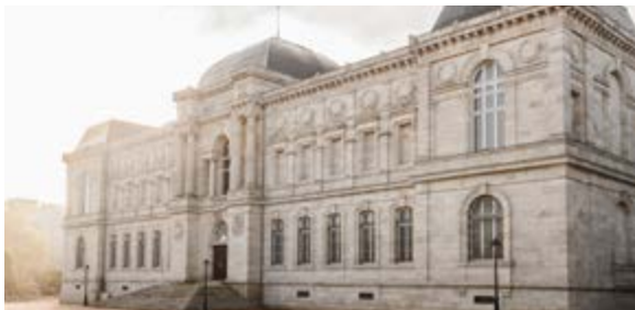
Musée Crozatier côté jardin