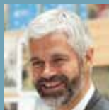
Laurent Wauquiez, président de la Région Auvergne-Rhône-Alpes

Ces dernières années, la Région Auvergne Rhône-Alpes a souhaité renforcer sa présence aux côtés des communes, pour être au plus près des projets des habitants. Le Contrat Ambition Région en est la pierre angulaire. Grâce à ces aides régionales, de nombreuses initiatives portées localement sont ainsi encouragées, et peuvent aujourd'hui voir le jour. Je m'en réjouis.