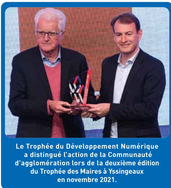
Le Trophée du Développement Numérique a distingué l'action de la Communauté d'agglomération lors de la deuxième édition du Trophée des Maires à Yssingeaux en novembre 2021.

en compétences du numérique local. De par son pro-