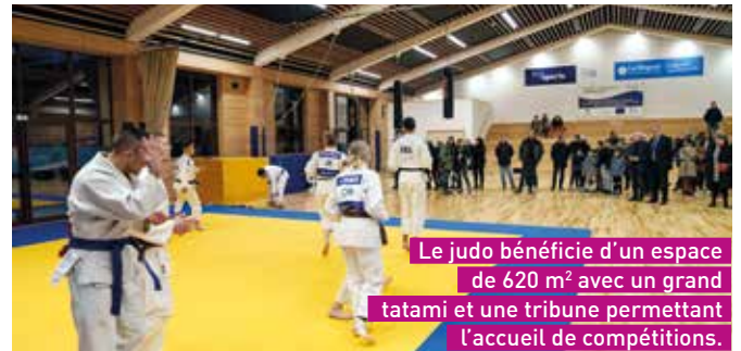
Le judo bénéficie d'un espace de 620 m 2 avec un grand tatami et une tribune permettant l'accueil de compétitions.

La subvention de la Région s'élève ici à 55 % du coût total du chantier. Vient ensuite le Feder, l'État et la Communauté d'agglomération du Puy-en-Velay. "L'une de nos priorités régionales dans le domaine du