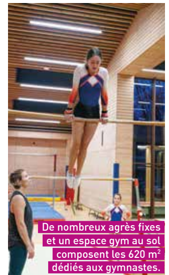
De nombreux agrès fixes et un espace gym au sol composent les 620 m 2 dédiés aux gymnastes.

sport, est de donner une impulsion à l'investissement pour la création d'équipements sportifs publics de proximité. La halle multisports s'inscrit dans un projet cohérent. Cet équipement forme un grand ensemble sportif, dans la continuité des différentes installations sportives situées à proximité, avec d'un côté, le stade d'Aiguilhe, et de l'autre, les tennis extérieurs du Puy-en-Velay et le complexe sportif Massot accessible à deux pas par les rives de la Borne" précise Laurent Wauquiez.