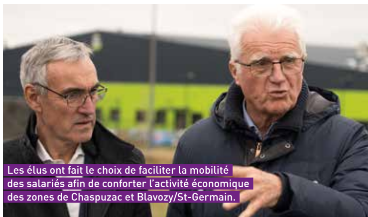
Les élus ont fait le choix de faciliter la mobilité des salariés afin de conforter l'activité économique des zones de Chaspuzac et Blavozy/St-Germain.

Les entreprises intéressées ont la possibilité d'être accompagnées dans leur démarche par les services de l'Agglo. Des outils méthodologiques sont téléchargeables sur mobilite.lepuyenvelay.fr . Le service Mobilité est à leur disposition au 04 71 02 60 11, du lundi au vendredi de 8h à 12h et de 13h30 à 18h.