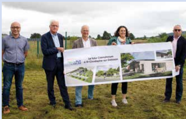
L'annonce a été faite lors du dernier conseil communautaire : la construction du futur crématorium se fera à St-Christophe-sur-Dolaizon.

de la sublime expo Autoportraits au musée Crozatier, amusez-vous au rythme des nombreux festivals et fêtes qui animent le territoire et flânez au gré de vos envies dans nos si jolis villages et bourgs-centre !