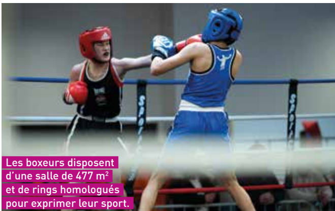
Les boxeurs disposent d'une salle de 477 m 2 et de rings homologués pour exprimer leur sport.