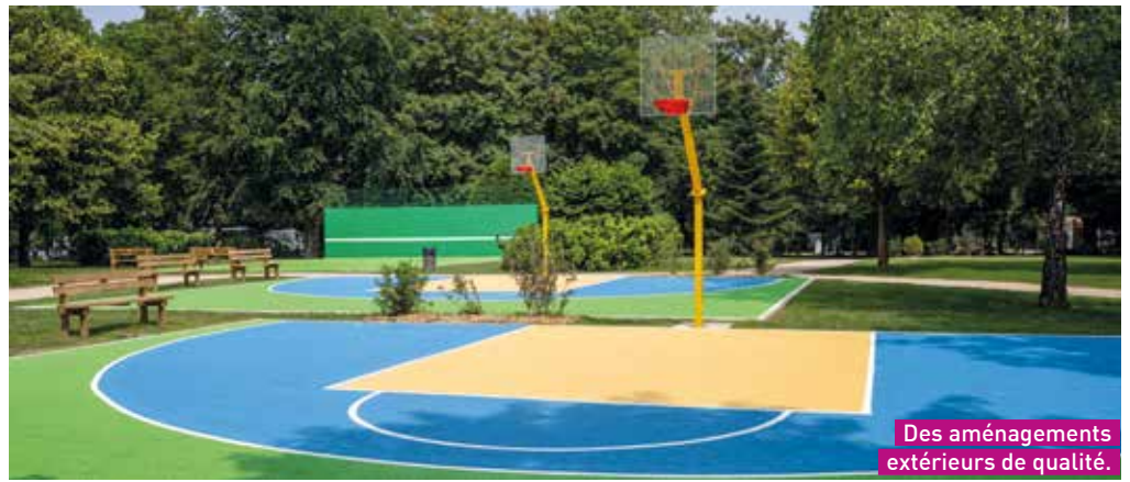
Des aménagements extérieurs de qualité.

La sonorisation de cet espace a été étudiée de façon à couvrir le bruit généré par le public dans le bâtiment, afin d'avoir une acoustique agréable et de grande qualité. Des panneaux en bois perforés et des plafonds en lambourdes bois ont été uti-