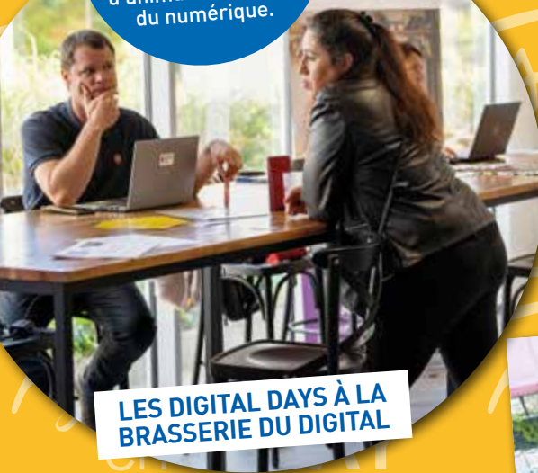
LES DIGITAL DAYS À LA BRASSERIE DU DIGITAL

Les 2 e Digital Days se sont déroulés à la Brasserie du Digital en proposant deux jours d'événements et d'animations autour du numérique.