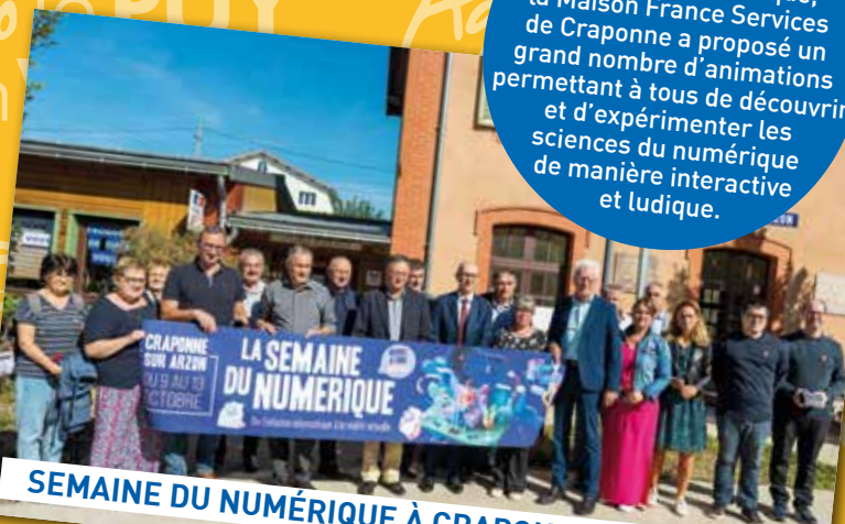
SEMAINE DU NUMÉRIQUE À CRAPONNE-SUR-ARZON

Du 9 au 13 octobre, dans le cadre de la semaine du numérique, la Maison France Services de Craponne a proposé un grand nombre d'animations permettant à tous de découvrir et d'expérimenter les sciences du numérique de manière interactive et ludique.