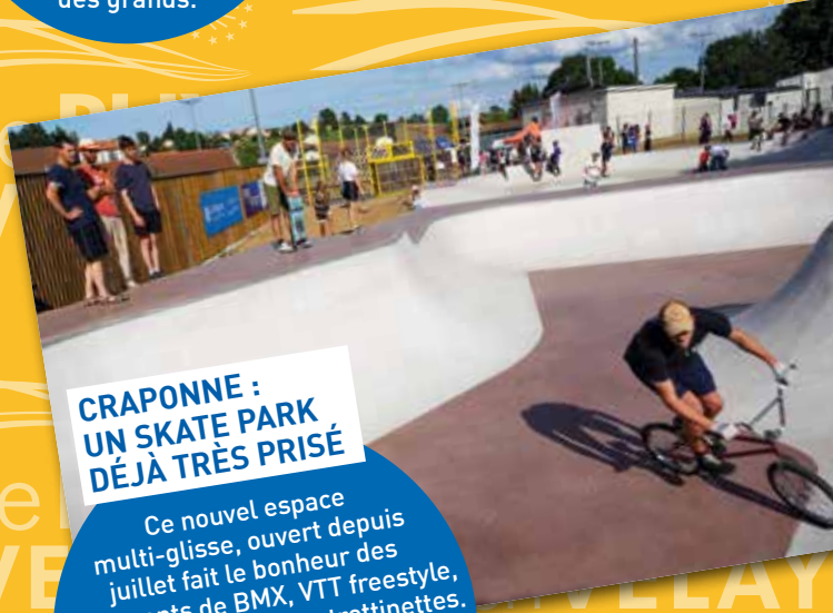
CRAPONNE : UN SKATE PARK DÉJÀ TRÈS PRISÉ

Pleinement engagée dans la transition écologique, l'Agglomération a mis en place 10 aires de covoiturage, sur l'ensemble de son territoire, afin de faciliter cette pratique éco-citoyenne. Parmi celles-ci, l'aire de Sembadel gare et ses 15 places de stationnement, a été inaugurée cet été.