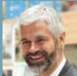
Laurent Wauquiez, président de la Région Auvergne-Rhône-Alpes

Ces dernières années, la Région Auvergne Rhône-Alpes a souhaité renforcer sa présence aux côtés des communes, pour être au plus près des projets des habitants. Le Contrat Ambition Région en est la pierre angulaire. Grâce à ces aides régionales, de nombreuses initiatives portées localement sont ainsi encouragées, et peuvent aujourd'hui voir le jour. Je m'en réjouis.