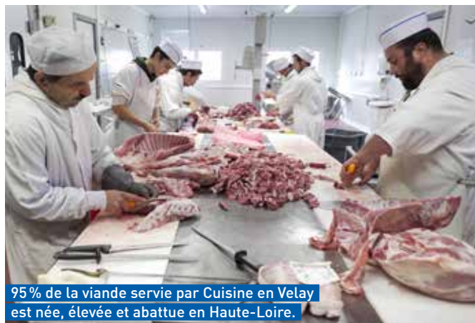
95% de la viande servie par Cuisine en Velay est née, élevée et abattue en Haute-Loire.