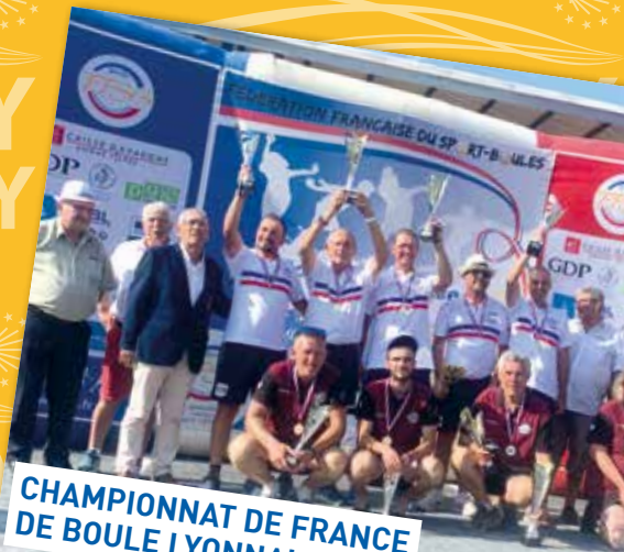
CHAMPIONNAT DE FRANCE DE BOULE LYONNAISE