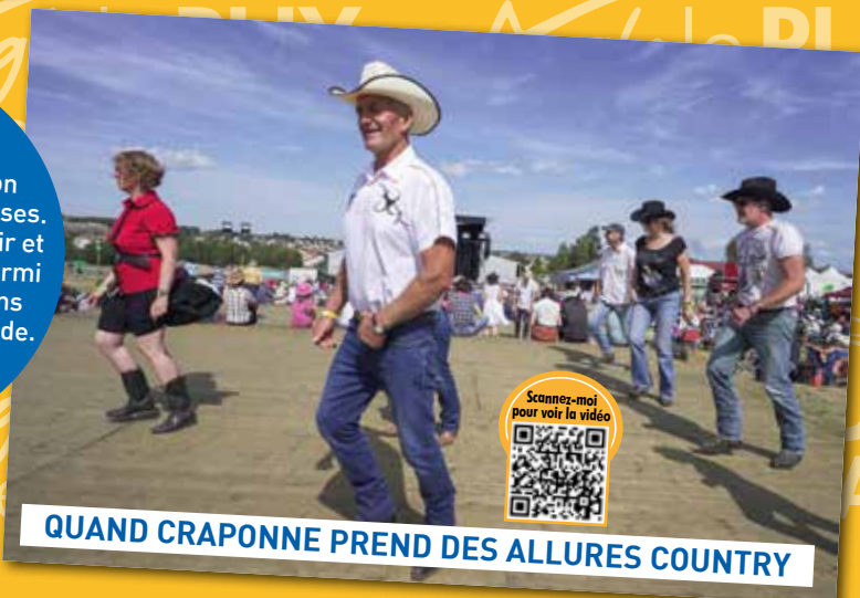
QUAND CRAPONNE PREND DES ALLURES COUNTRY