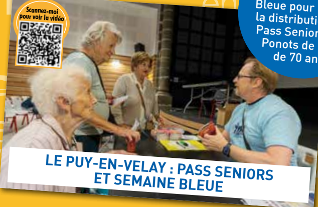
LE PUY-EN-VELAY : PASS SENIORS ET SEMAINE BLEUE

Les élus et le CCAS du Puy ont profité de la Semaine Bleue pour lancer la distribution des Pass Seniors aux Ponots de plus de 70 ans.