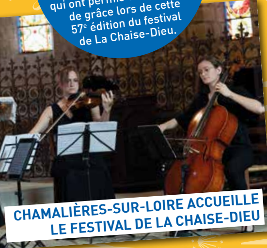
CHAMALIÈRES-SUR-LOIRE ACCUEILLE LE FESTIVAL DE LA CHAISE-DIEU