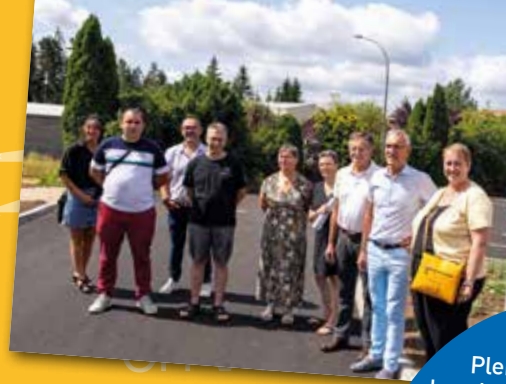
BIENVENUE DANS NOS AIRES DE COVOITURAGE