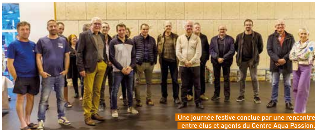
Une journée festive conclue par une rencontre entre élus et agents du Centre Aqua Passion.

Centre Aqua Passion Les Prés d'Emblavez 43800 Lavoûte-sur-Loire Tel. 04 71 08 15 71 www.cap43.fr