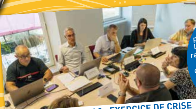
BRIVES-CHARENSAC : EXERCICE DE CRISE "PRÉVENTION INONDATION"

Du 9 au 13 octobre, dans le cadre de la semaine du numérique, la Maison France Services de Craponne a proposé un grand nombre d'animations permettant à tous de découvrir et d'expérimenter les sciences du numérique de manière interactive et ludique.