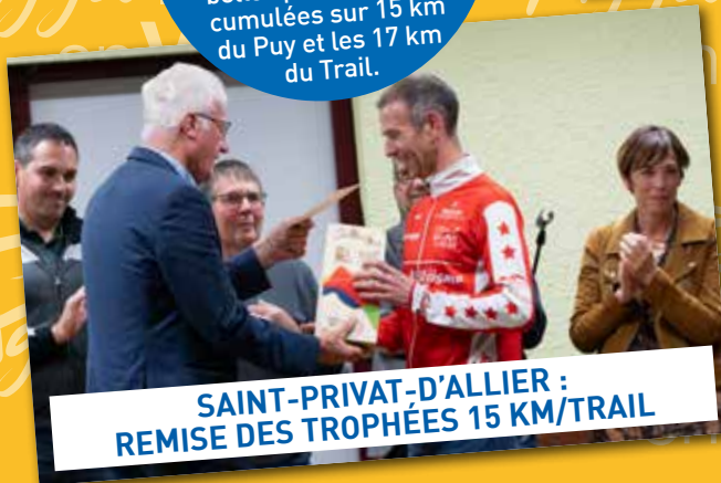
SAINT-PRIVAT-D'ALLIER : REMISE DES TROPHÉES 15 KM/TRAIL

Lors de la réception des bénévoles du Grand Trail du Saint-Jacques by UTMB, les vainqueurs du Challenge de la Ville ont été récompensés pour leurs belles performances cumulées sur 15 km du Puy et les 17 km du Trail.