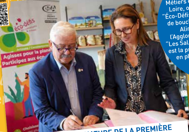
LE PERTUIS : SIGNATURE DE LA PREMIÈRE CONVENTION ÉCO-DÉFIS AGGLO/CMA