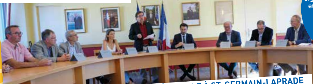
SIGNATURE D'UN CONTRAT DE MIXITÉ SOCIALE À ST-GERMAIN-LAPRADE

Premier du genre en Haute-Loire, le contrat de mixité sociale signé vendredi 29 septembre entre St-Germain-Laprade et l'État va permettre à la commune de lancer un programme de constructions de 57 logements sociaux !