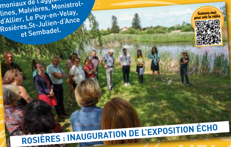
ROSIÈRES : INAUGURATION DE L'EXPOSITION ÉCHO